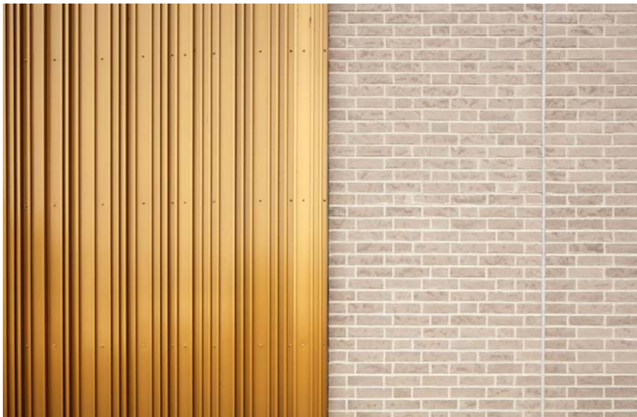
IPF Treff Bopfingen_1017_Ir.jpg

Duraflon® war die Oberflächenlösung für merz objektbau, die als Planer und Betreiber des Einkaufszentrums gezielt nach einer nachhaltigen, qualitätvollen und wartungsarmen Lösung für die Fassade suchten.