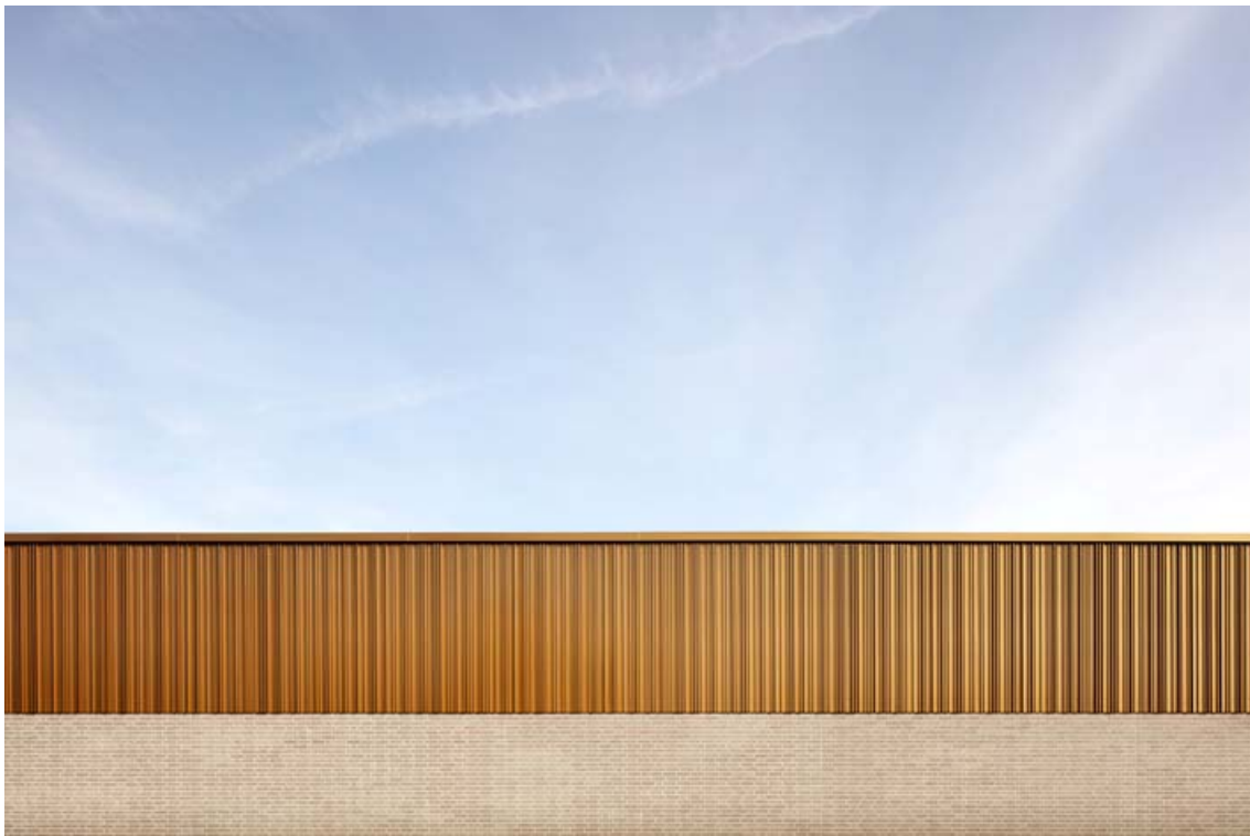
IPF Treff Bopfingen_1079_Ir.jpg

Schönes Farb- und Materialspiel: Der fein-matte Glanz der goldenen Duraflon® - Oberfläche geht mit natürlich wirkendem Klinker an den Fassaden des IPF Treff in Bopfingen eine harmonische Verbindung ein.