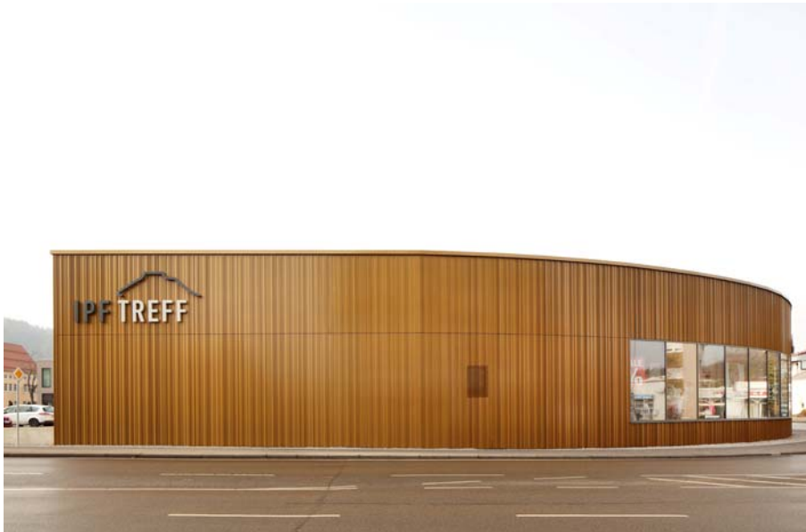
IPF Treff Bopfingen_1014_Ir.jpg

Duraflon® war die Oberflächenlösung für merz objektbau, die als Planer und Betreiber des Einkaufszentrums gezielt nach einer nachhaltigen, qualitätvollen und wartungsarmen Lösung für die Fassade suchten.