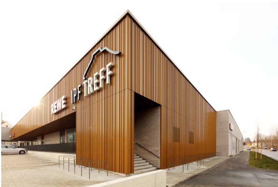
IPF Treff Bopfingen_1021_Ir.jpg

Die Architekten stellten sich für die Fassaden den fein-matten Glanz einer eloxierten Oberfläche vor. HD Wahl setzte den Wunsch-Farbtönen mit Duraflon® um – die Einbrennlackierung auf Fluorpolymerbasis punktet gegenüber einem Eloxal durch ihre farbgleiche, dauerhafte Oberfläche und einen deutlich geringeren Reinigungs- und Wartungsaufwand.