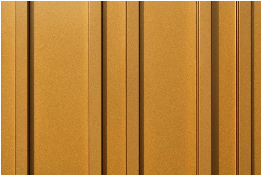
IPF Treff Bopfingen_1049_Ir.jpg

Die Architekten stellten sich für die Fassaden den fein-matten Glanz einer eloxierten Oberfläche vor. HD Wahl setzte den Wunsch-Farbtönen mit Duraflon® um – die Einbrennlackierung auf Fluorpolymerbasis punktet gegenüber einem Eloxal durch ihre farbgleiche, dauerhafte Oberfläche und einen deutlich geringeren Reinigungs- und Wartungsaufwand.