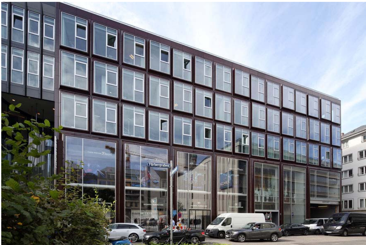
Hofstatt-0002_kl.jpg: Repräsentative Keramikfassade am Färbergraben.