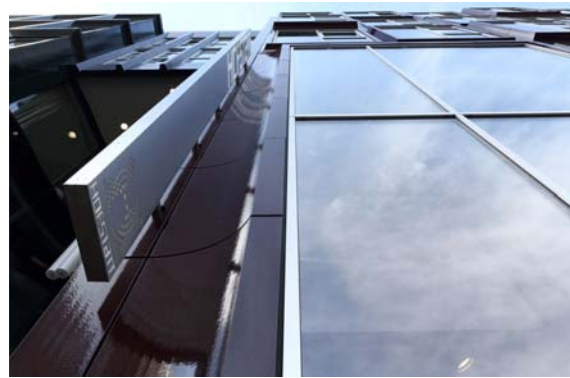
Hofstatt-0017_kl.jpg: Zarte, von HD Wahl eloxierte Fensterabdeckleisten strukturieren die klaren Flächen.