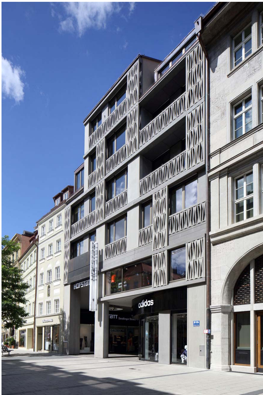
Hofstatt-0039_kl.jpg: Plastische Fassaden: Hauptzugang zum Hofstatt Areal über einen Neubau. Rechts daneben das denkmalgeschützte, ehemalige Redaktionsgebäude der Süddeutschen Zeitung.