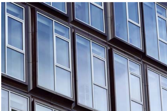
Hofstatt-0032_kl.jpg: Die durch die Fensterflächen wahrnehmbare Pfosten-Riegel-Konstruktion und die Abdeckleisten der Fenster wurden von HD Wahl in einem neutralen Edelstahlton eloxiert.