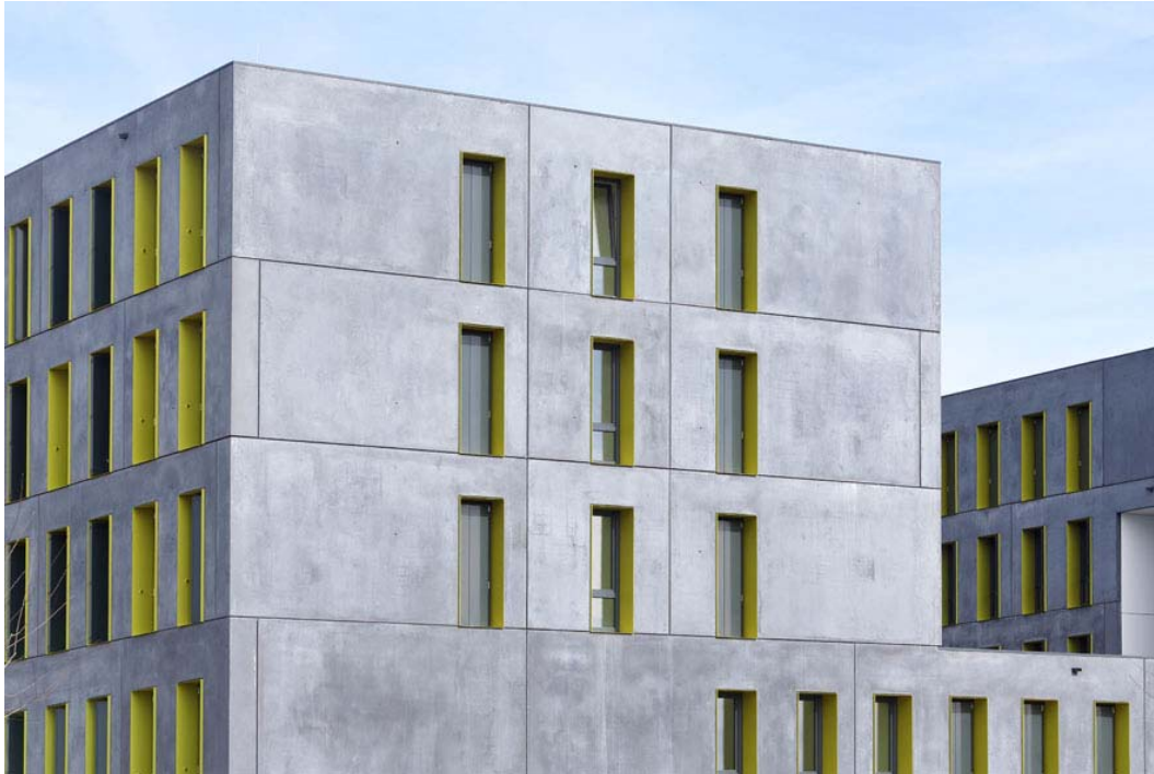
Campus Oberer Eselsberg_E72T5607