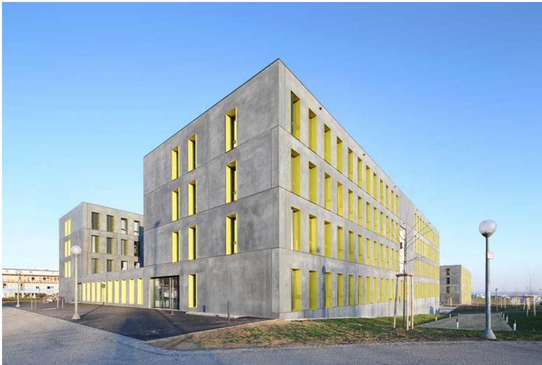
Campus Oberer Eselsberg_E72T6040