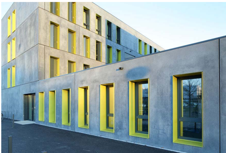
Campus Oberer Eselsberg_E72T5529