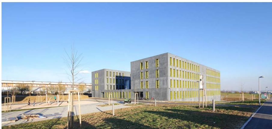
Campus Oberer Eselsberg_E72T5419