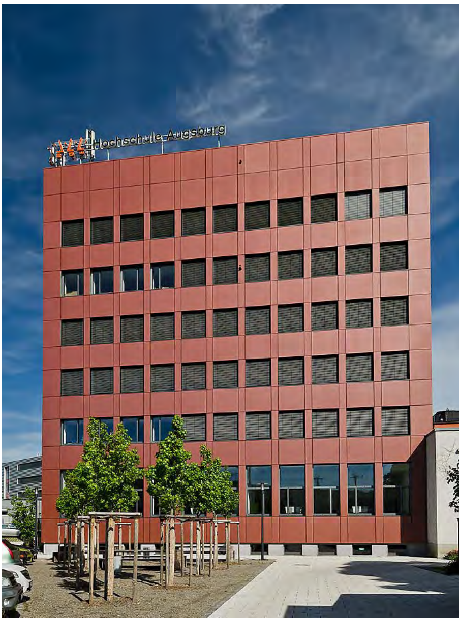
13-05-28_HSA-E-Trakt_193, © Eckhart Matthäus, Augsburg

Objekt Hochschule Augsburg, Gebäude E, Augsburg/DE Bauherr Bayerisches Staatsministerium für Wissenschaft, Forschung und Kunst Projektleitung Staatliches Bauamt Augsburg, Augsburg/DE Architekt Gilg • Peer • Wolff Architekten, Augsburg/DE Bauleitung Kessler und Rupp, Augsburg/DE Metallbau Regensburger Metallbau, Regensburg/DE Fertigstellung 03/2011 Oberfläche DURAFYLON® Rotton KMW 1328-9 von HD Wahl GmbH, Jettingen-Scheppach/DE Fotos © Eckhart Matthäus, Augsburg | www.em-foto.de